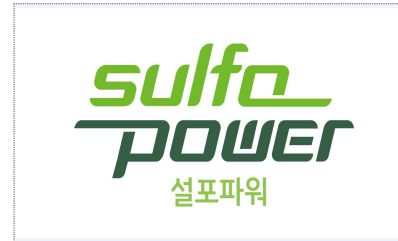
설포파워 BI 개발(2024)