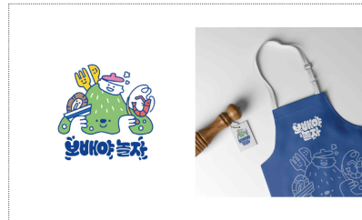
관광로데로컬브랜드 브랜딩 - 보배야놀자(2025)