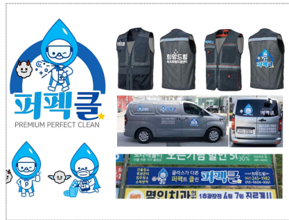
(주)목포희망드림센터 브랜드 개발(2020)