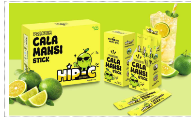
힘씨 브랜드,패키지 디자인개발(2025)