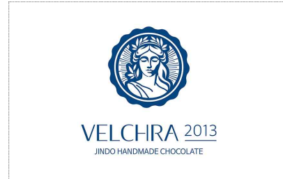
벨크라-브랜드 디자인 제작(2025)