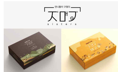
자매가 브랜드/포장패키지 제작(2025)