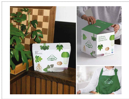
나물사랑 브랜드디자인 및 패키지개발(2025)