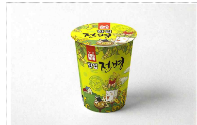
농협 우리밀-한입전병 포장디자인 개발(2023)