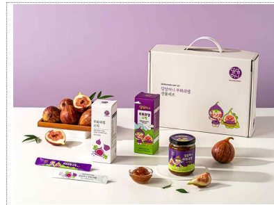
해송무화과 Bi & Packaging Design (2024)