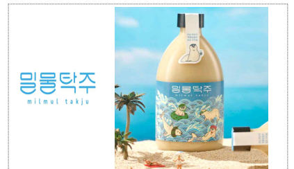
밀물탁주 BI & 포장디자인 개발(2023)