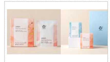
보림제다 패키지 블랜딩 디자인 개발