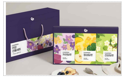
참든 포장디자인 개발(2025)