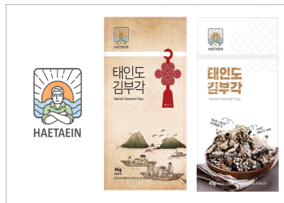
태인도김부각 브랜드 개발 및 패키지디자인(2024)