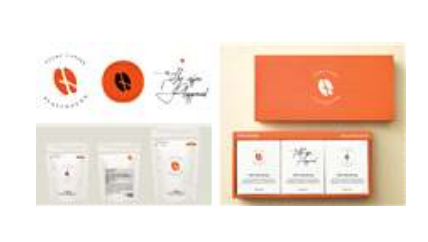
털보네 커피놀이터 브랜드 리뉴얼(2023)