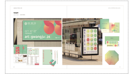
아트광주 이벤트 아이덴티티 구축 (2024/2025)