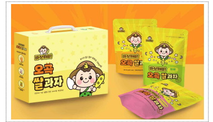
바삭깨비 브랜드,패키지 디자인개발(2025)