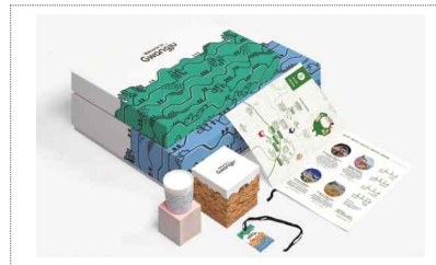
광주관광공사 관광기념품 디자인 개발(2024)