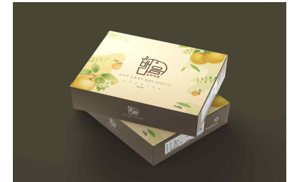
가시비시농원 브랜드/포장패키지 제작(2025)