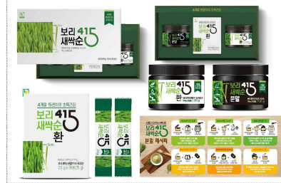
새싹보리 세트 브랜드, 패키지디자인 개발(2020)