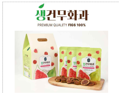
무화담(주) 브랜드&디자인 융합개발(2025)