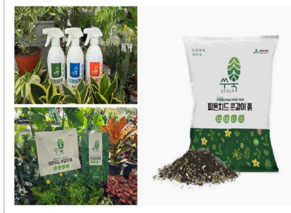
삼마바이오텍 브랜드&포장디자인 개발(2025)