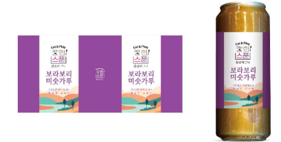
울촌보라마을 브랜드/포장패키지 제작(2025)