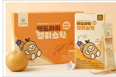
천년가향 포장디자인 개발(2025)