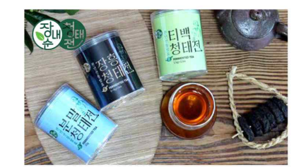
장내순청태전 브랜드 및 포장디자인 개발