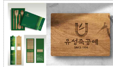
유성공예사 브랜드 및 포장디자인 개발(2023)