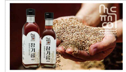
석두쟁이 브랜드 및 포장디자인 개발(2024)