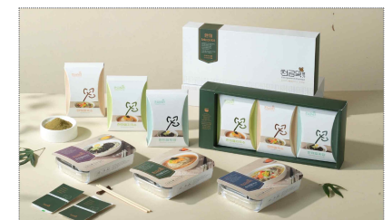
천금목명가 패키지 디자인 제작(2023)