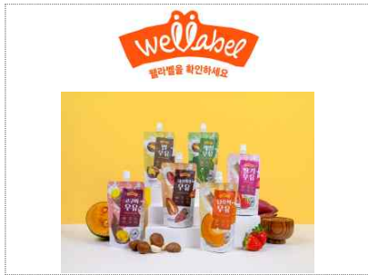
웰라벨 신규 브랜드&패키지 개발(2025)