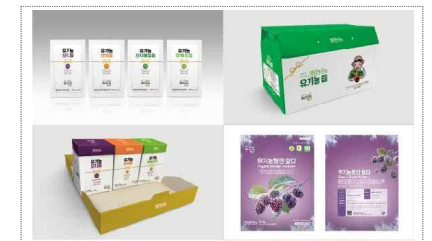
명랑농원 포장디자인 개발(2024)