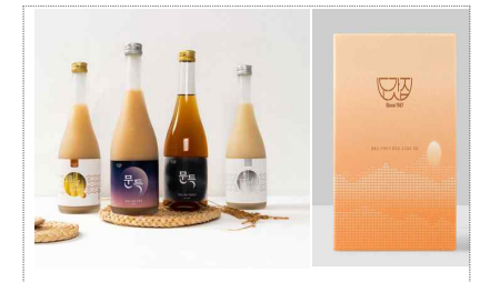
도갓집 전동식품 경쟁력강화 포장디자인(2025)