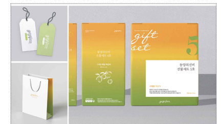
그리울푸드 패키지 디자인 제작(2023)