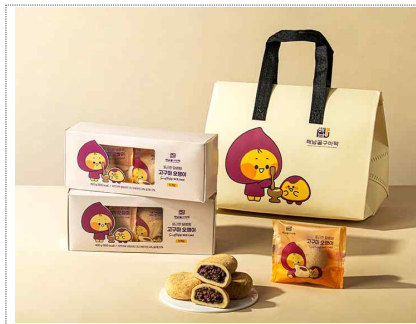
해남 고구마떡 브랜드 및 포장디자인개발(2025)