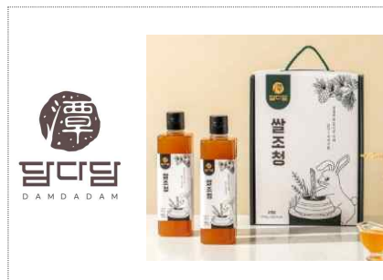
담다담 브랜드 및 포장디자인 개발(2024)