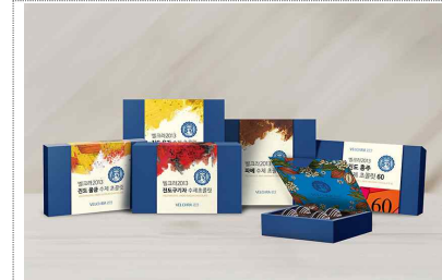
벨크라-진도홍주 초콜릿 포장패키지 제작(2025)