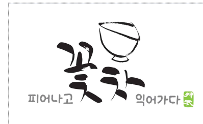
초의차 BI 개발(2024)