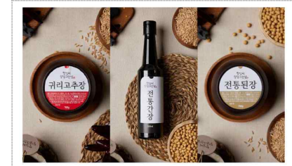
강진원장 브랜드 및 포장디자인 개발(2023)