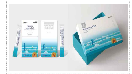
다사랑 수출기반구축 포장디자인개발 (2025)