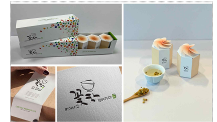
초의차 패키지 디자인 제작(2024)