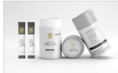
오엠오 '오엠오프로' 브랜드&패키지 개발(2022)