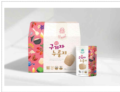
신비라-브랜드 및 패키지디자인 개발(2025)