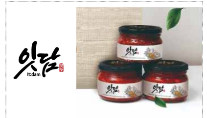
장흥식품 CI & BI & 포장디자인 개발(2021)