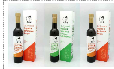
전남 유기농 명인 브랜드 및 포장디자인(2024)