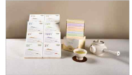
운해다원 브랜드 리뉴얼 및 티 선물세트 패키지 개발(2025)