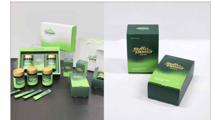
설포파워 패키지 디자인 제작(2024)