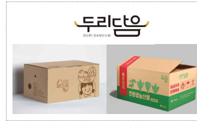
두리담음 패키지 및 시제품제작 (2025)