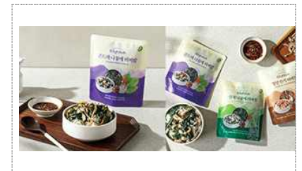
농업회사법인 담우 패키지 디자인 제작