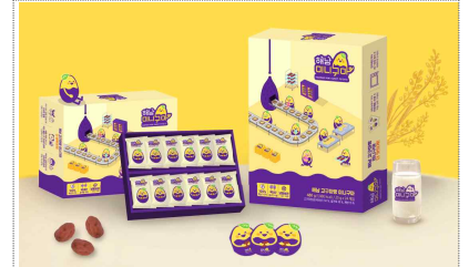
미니구마 브랜드, 패키지 디자인 개발(2023)