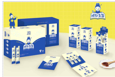
세자조청 브랜드, 패키지 디자인 개발(2023)