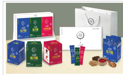
착해유 브랜드,패키지 디자인개발(2024)