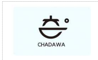
보림제다 Bi 개발(2024)