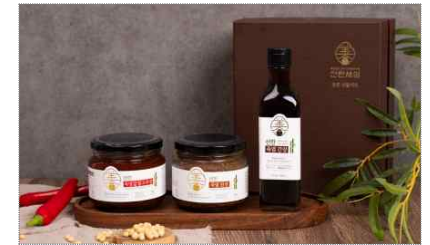
선한세상 브랜드 리뉴얼 및 장 패키지 선물세트 개발(2023)