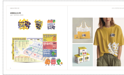
보령원도심 도시락 브랜딩(2025)