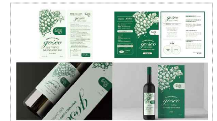
고서 와인 포장디자인 개발(2024)