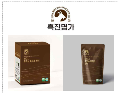
하모니흑염소식품 브랜드&디자인 융합개발(2025)