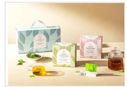
뜨라레 Bi & Packaging Design (2024)