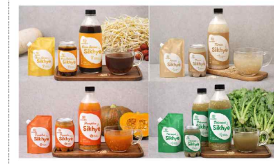
송시마을 브랜드 및 포장디자인 개발(2025)