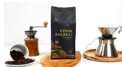
힐랑알토스 브랜드/포장패키지 제작(2025)