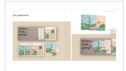
광주 스타공예상품 디자인 개발(2024)