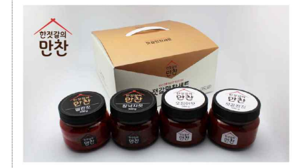
다도해담 브랜드 및 포장디자인 개발(2024)