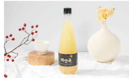
대마영농조합법인 포장패키지 제작(2025)