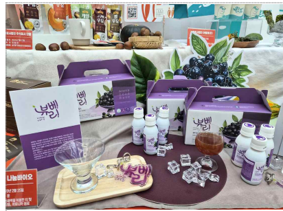
나눔바이오 BI/패키지디자인 개발(2025)