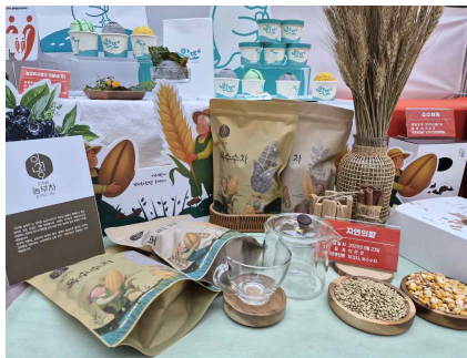
자연의밭 BI/패키지디자인 개발(2025)