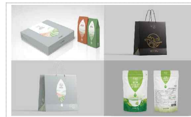
청룡다원 포장디자인 개발(2024)