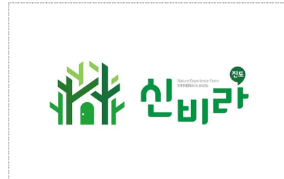
신비라-브랜드 디자인 제작(2025)