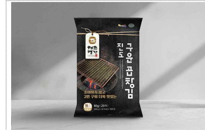
해초메가-구운곶감김 포장디자인 개발(2024)