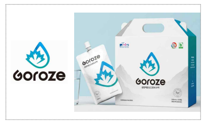
광양고로쇠수액 BI & 포장디자인 개발(2025)