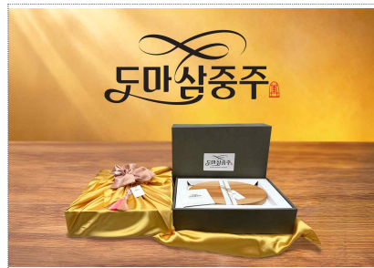
금정목공예 브랜드 개발 및 패키지디자인(2024)