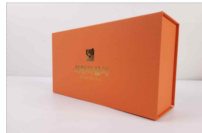
명원정 CI/패키지 개발(2024)