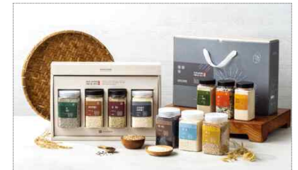
염산사회적협동조합 '은빛미담' 브랜드&패키지 디자인 개발(2020)