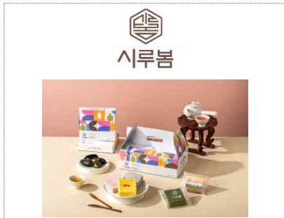
시루봄 신규 브랜드&패키지 개발(2024)