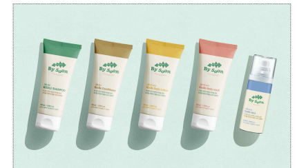
순천고들빼기영농조합법인 바이순 신규 브랜드 개발 및 화장품 패키지 개발(2022)