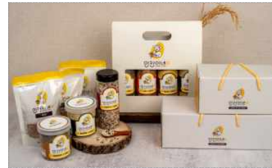
인천이네 브랜드 리뉴얼 및 쌀 선물세트 패키지 개발(2023)