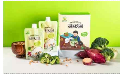
롱강아지 브랜드 리뉴얼 및 펫요거트 패키지 개발(2025)