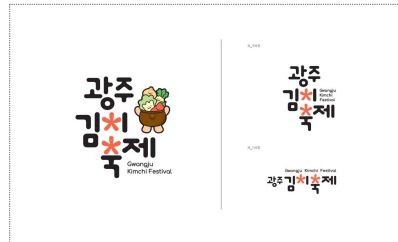
광주김치축제 BI 및 캐릭터 디자인 개발(2023)