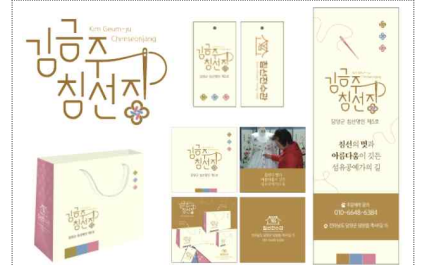
침선명인 브랜드, 한복 패키지 디자인 개발(2022)