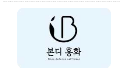
최경주홍화팜 Bi 개발 (2023)