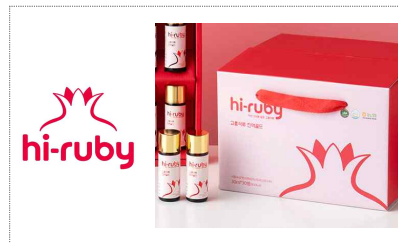
고흥석류 BI & 포장디자인 개발(2022)