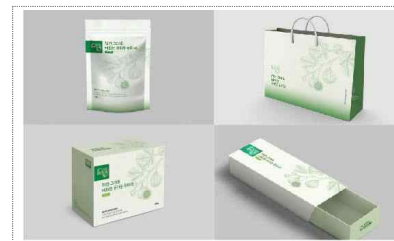
여화원 포장디자인 개발(2024)