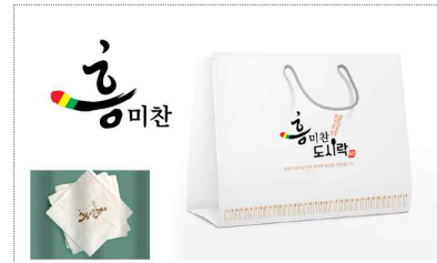
정남진피페 브랜드 및 포장디자인 개발(2021)