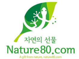
천연80-브랜드 디자인 제작(2022)