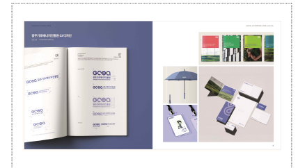
광주기후에너지친환경원 CI 개발(2023)