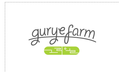
그리울푸드 BI 개발(2023)