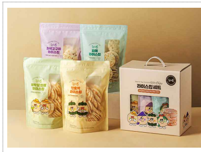
2025년 전라남도 상품 브랜드디자인 및 마케팅전략 개발(2025)