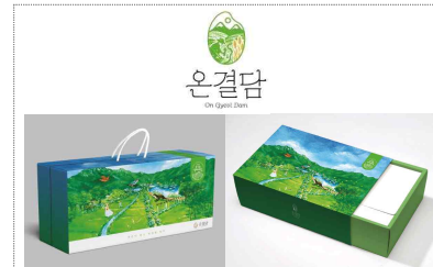
태인생태마을 브랜드/패키지 개발 (2025)