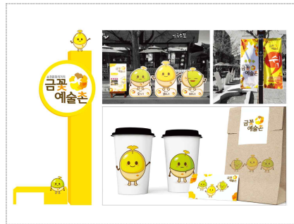
순천문화의거리 브랜드 개발(2018)