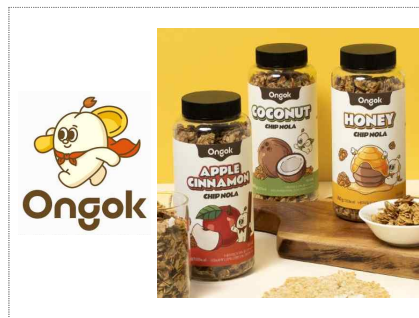
팜투글로벌 브랜드 및 포장디자인 개발(2025)