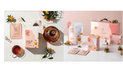
최경주홍화팜 홍화차 패키지 디자인 제작