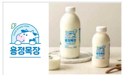
용정목장 브랜드 및 포장디자인 개발(2024)