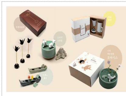
수수하게 브랜드&포장디자인 개발(2025)