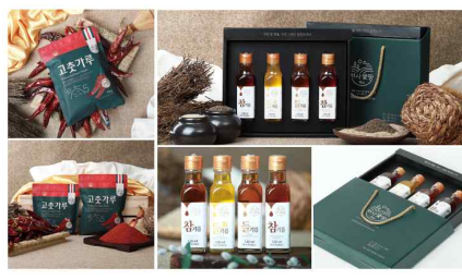
고춧가루, 들기름, 참기름 디자인 제작(2019)