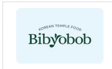
농업회사법인 담우 Bi 개발 (2023)