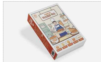
미카129 밥스테라 신규 브랜드 개발 및 카스테라 믹스 패키지 개발(2023)