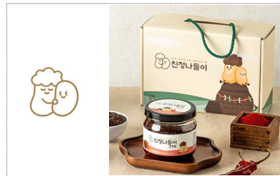
천정나들이 BI & 포장디자인 개발(2023)